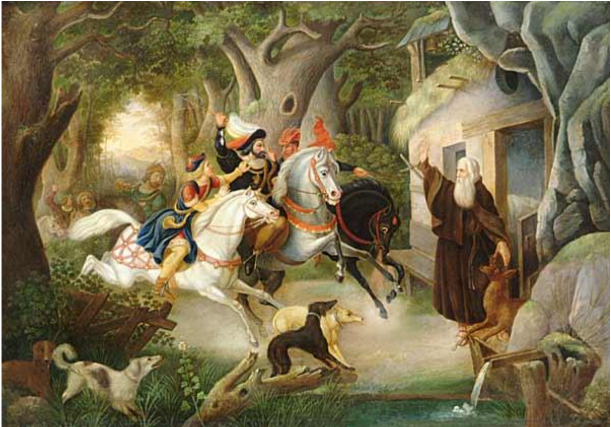
Neznámý autor: Setkání knížete Oldřicha s poustevníkem Prokopem