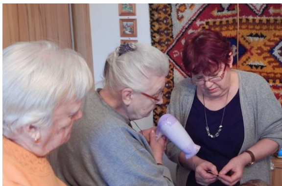
Fronta na fén