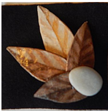
Zuzka: Kaširovaný šperk

Budeme uvidět, která z dam přinese příští týden hotový artefakt.