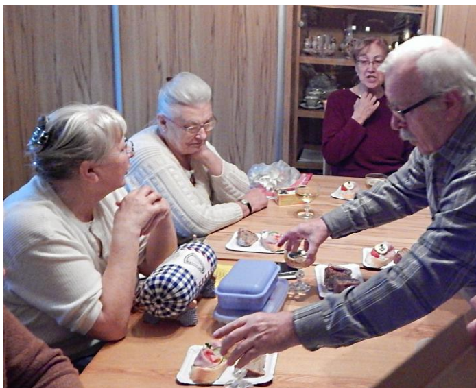
Pinglování „drogy pravdy“ (In vino veritas)