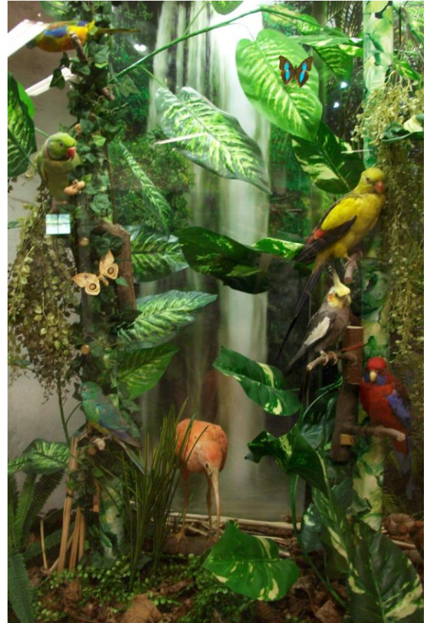
Na zámku je stále něco nového a hrabě je nejpovolanejší průvodce. Zde expozice Mořský svět a Papoušci.