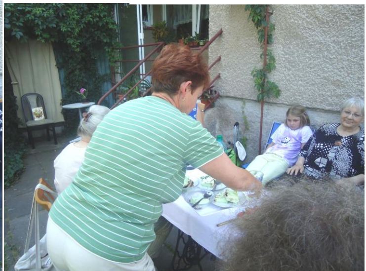
Jídlo a pití je nesená na stůl