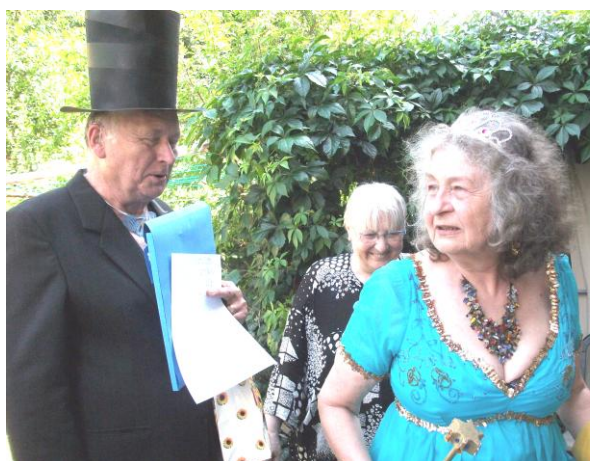
13. - Oficiální část akce je prohlášena za ukončenou.

Následuje část společenská, spočívající v požívání, povídání a popíjení, přičemž i Její Veličenstvo projevuje svého demokratického ducha a baví se s obyčejným plebem, jak vidno z dalších fotek: