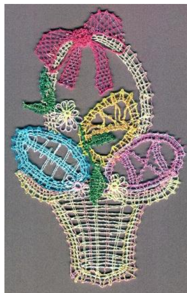
Alena „plete“ koše nejen květinové.