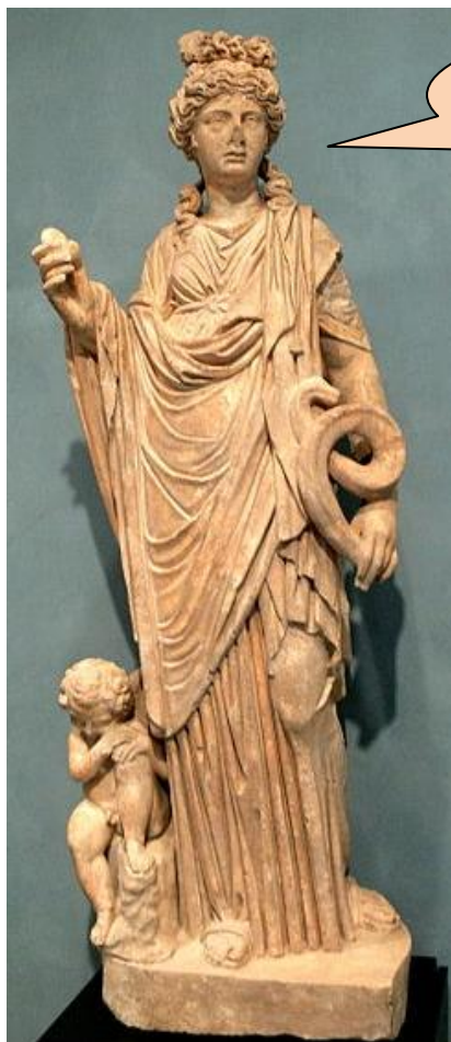
Hygieia - bohyně zdraví a čistoty

Náš rektor je zárukou, že tato ozdravná opatření budou řádně splněna.