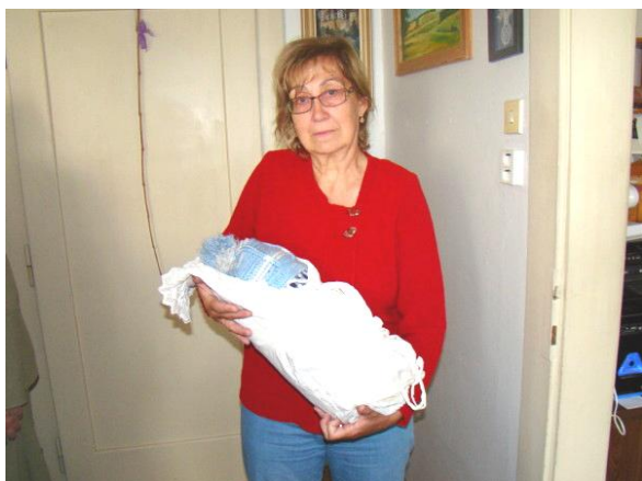
Mnohopárka a Helena