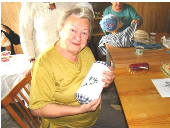
Polohodka a Jarka