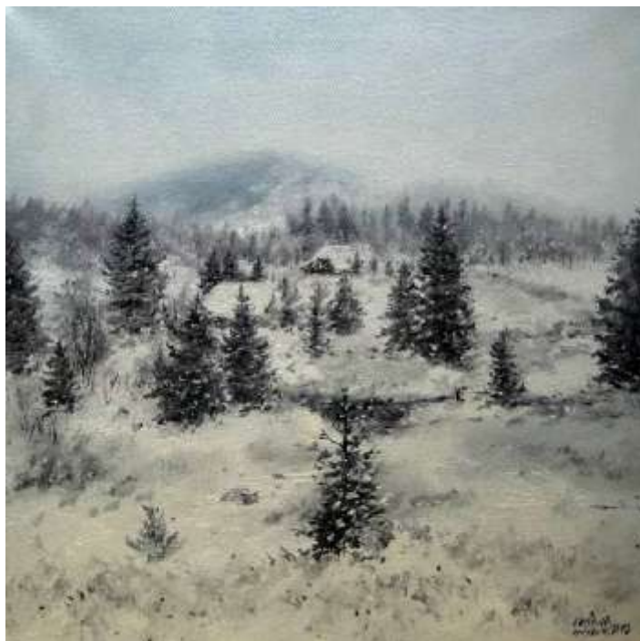
Milan ČIHÁK - Sodom