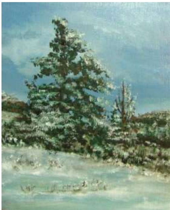
Michaela BEDNÁŘOVÁ - Firthy

Na rozloučenou se zimou pár zimních obrázků našich kolegů.