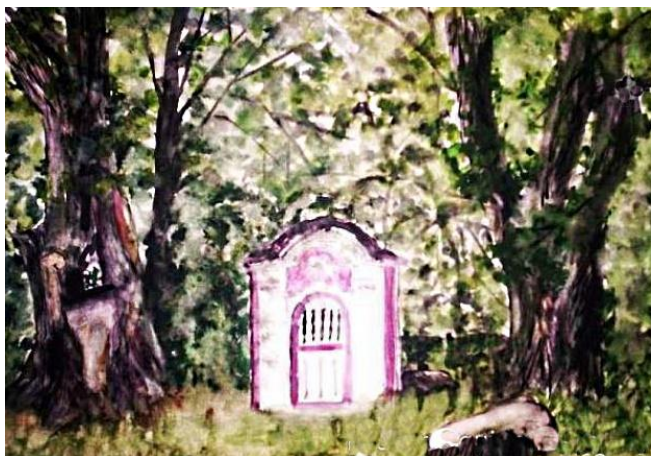
Kaplička v Zahrádce

Než jí připravíme rozsáhlejší expozici, zatím malá ochutnávka či připomenutí dávných amatérsko-obrazářských časů: