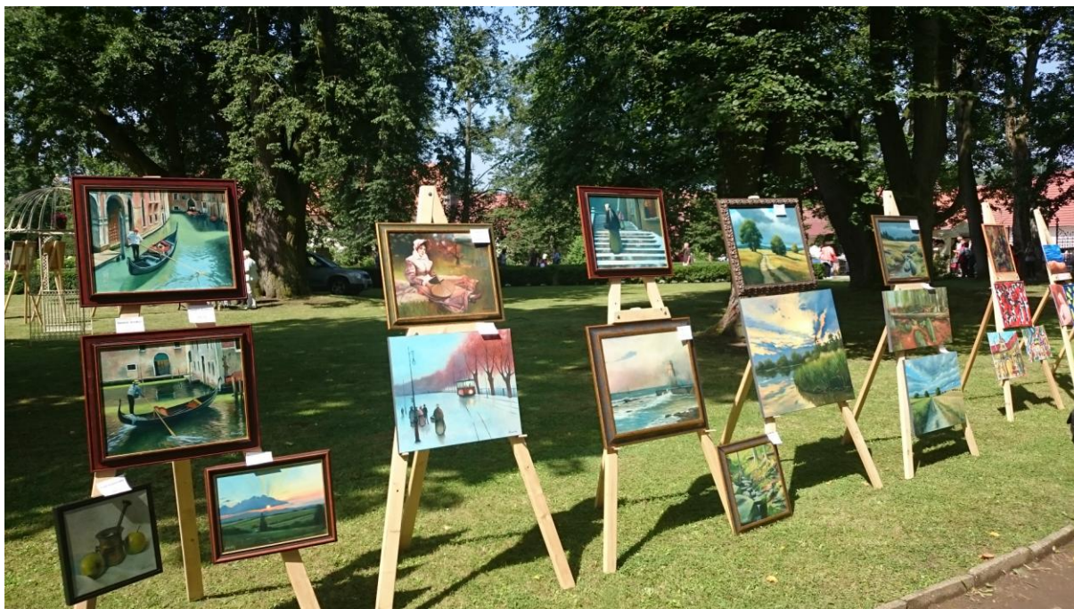
Výstava obrazů Pavla „Pabla“ Černoška, občas zvaného Břidličník - něco už si ale odnesli zájemci