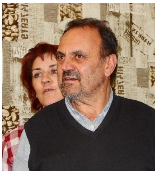
Tzv. Zámecké panstvo a damstvo