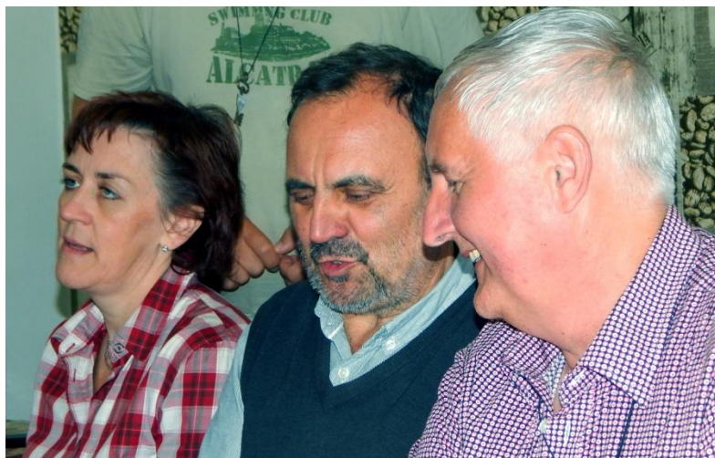
Trojice, bez níž by to nešlo. Prezident akce je ten Pětioký vpravo.