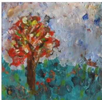
Beruška (5 let)