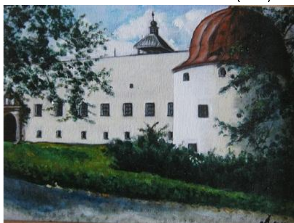
Jarka Š. (nepřítomna)